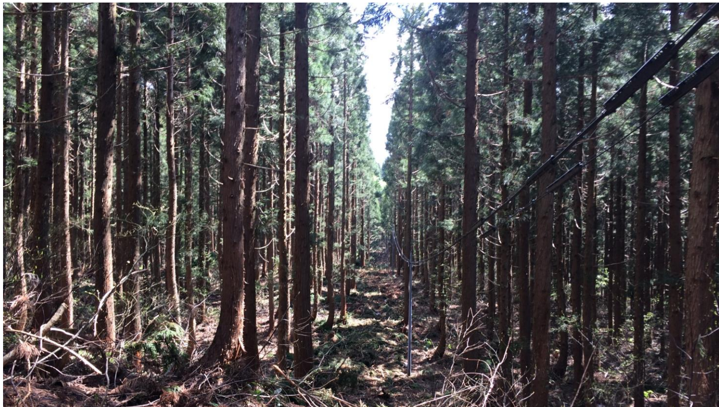
和山区の間伐施工地（林齢52年生） 列状間伐（間伐率20%）