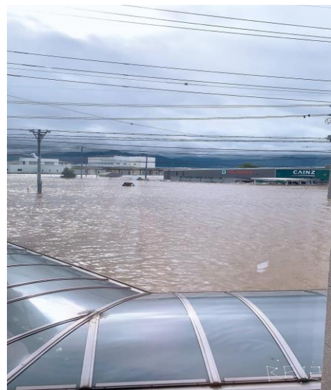
台風19号被害の18号沿いカインズホーム