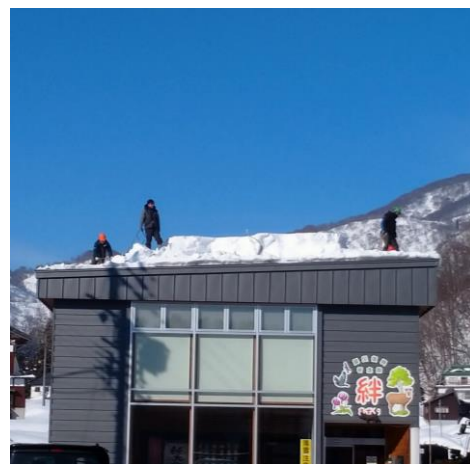
今年初めての雪下ろし、前日の雨で重い雪でした。

昨年と思えば、穏やかな年末年始でした。その後雪が降りましたが、去年の半分以下です。まだこれから降るとは思いますが、栄村でもコロナウイルスが流行りましたが、ワクチン接種が進んでいるお陰で重症化する事もなく回復している様です。倒木による停電が起きないように、ライフライン事業も順調です。春から引き続き電線近くの倒れそうな木の処理をして行く予定です。停電に備えて発電機を購入しました。一度使用しましたが、便利でしたよ。春期注文書を回覧しています。