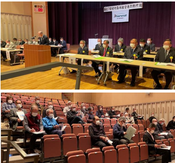
貸借対照表 令和5年2月28日現在