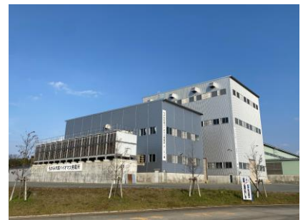
もがみバイオマス発電所(株)