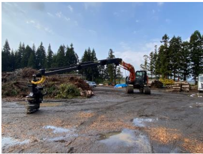
ロングリーチのグラップルソー （木寄せ、造材）

3日間の研修で学んだ事や、感じた事を今後の栄村林業の発展へ生かしていければと思います。