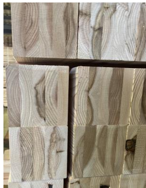
スギ板を張り合わせた集成材（角材）