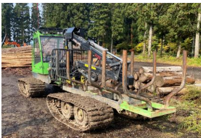
フォワーダ（運材機械）